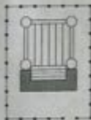
Hoppematras ■ = faldunderlag

Ved opstilling af hegn omkring forlystelsen skal der være en åbning på minimum 1 meters bredde.